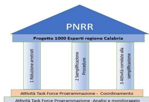
Fig. 1 I tre Pilastri del "Progetto 1000 Esperti"

Ciascun Pilastro è stato concepito tenendo conto dei target regionali definiti dal Piano territoriale, in particolare tenuto conto della scadenza intermedia prevista proprio a dicembre 2023 e la scadenza finale prevista per giugno 2025.