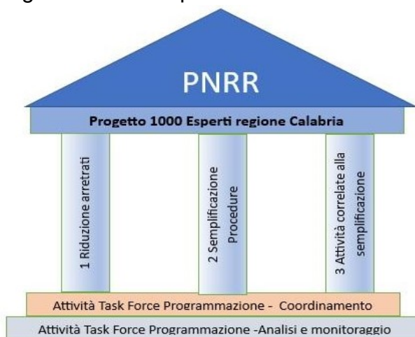
Fig. 1 I tre Pilastri del "Progetto 1000 Esperti"

Il Piano di lavoro degli esperti della Regione Calabria per l'anno 2023 è stato articolato su tre "pilastri" fondamentali, mirati al raggiungimento dei target regionali definiti dal Piano territoriale: riduzione degli arretrati (Pilastro 1) e riduzione dei tempi procedurali (Pilastro 2) , da verificarsi alla scadenza intermedia di Dicembre 2023 e alla scadenza finale di Giugno 2025; un terzo pilastro ( Pilastro 3 ) comprende tutte le attività che contribuiscono in maniera indiretta alla semplificazione delle procedure.